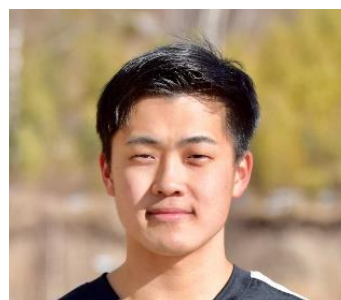
古野 慧 選手(スキークロス) 2022 冬季北京オリンピック スキークロス出場